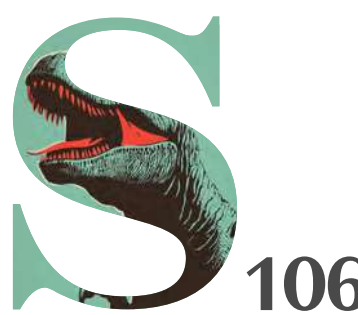
106 La parola del mese è: Social (anti) nutrition