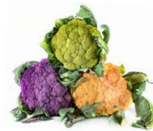
60 Proprietà nutrizionali: guida all'uso