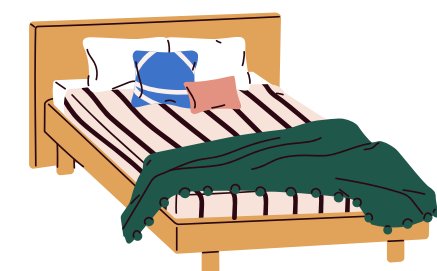
102 Casa zero waste: l'angolo della buonanotte